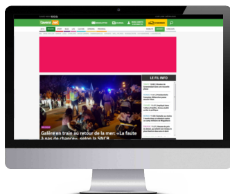
TV Leaderboard (995x250)

TV Leaderboard / Halfpage à 30 000 impressions = 660€