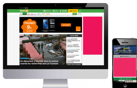
Halfpage (sticky) (300x600)