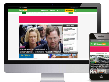
XL Leaderboard (995x123)

XL Leaderboard/Medium Rectangle à 30 000 impressions = 450€